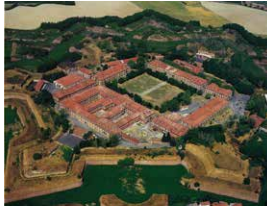
Citadel of Alessandria.

It's necessary to have the accepted registration Places are limited